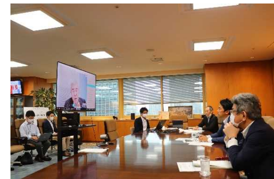
左：第2回意見交換会 右：第3回意見交換会 （WEB開催）