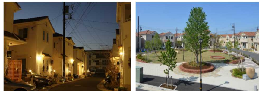
灯りのいえなみ協定 (LED外灯の全戸点灯)