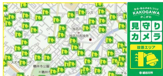
見守りカメラ設置位置