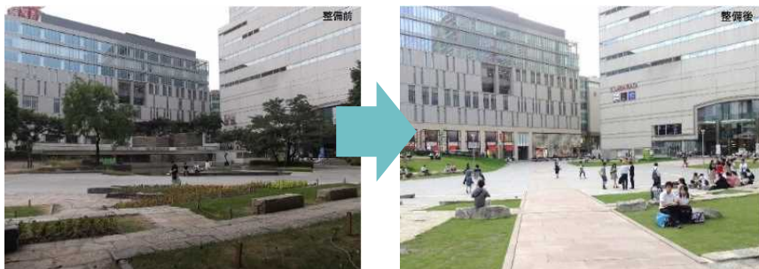
公園の整備前（左）、整備後（右）