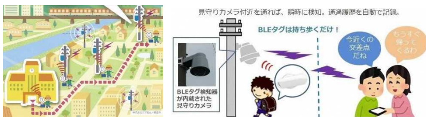
見守りサービスのイメージ