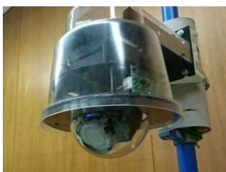
ビーコンタグ検知器 内蔵見守りカメラ