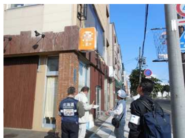
違反広告物パトロール