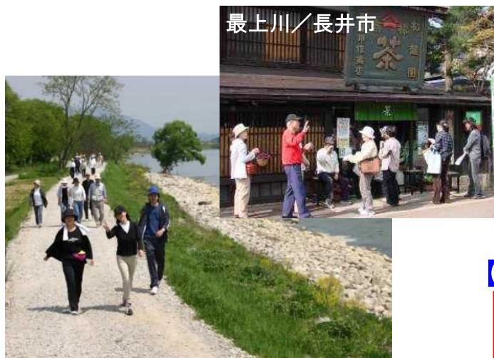
管理用通路をフットパスとして活用 (最上川)

治水上及び河川利用上の安全・安心に係る河川管理施設の整備を通じ、まちづくりと一体となった水辺整備を支援