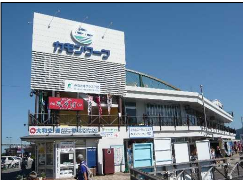
構成施設のイメージ