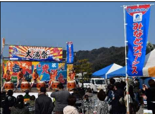
地域振興イベントの開催状況