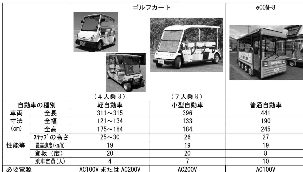
表 使用車両の規格

※カートの車両寸法については、手配する車両のメーカー及び車種等によって変動する。