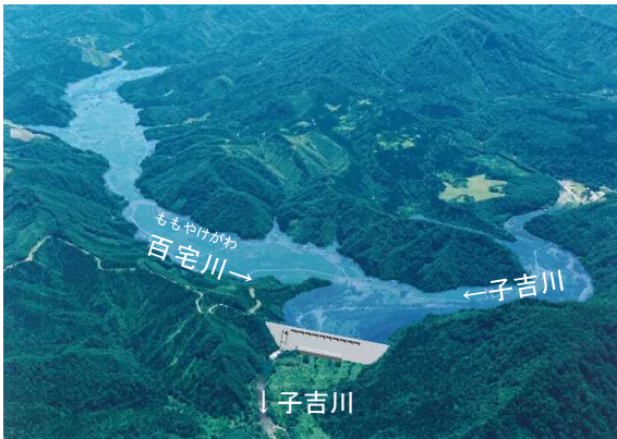
鳥海ダム完成イメージ図