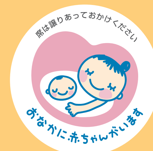
マタニティ マーク