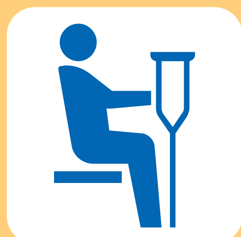
障害のある方 けがをされている方