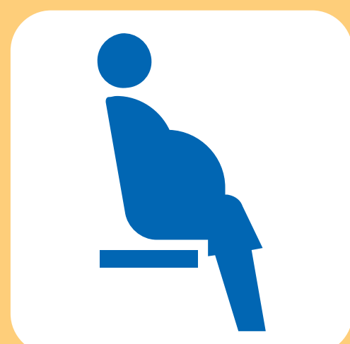
妊娠されて いる方