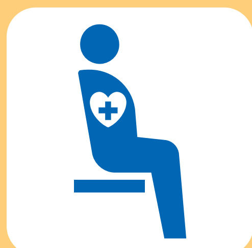
内部障害の ある方