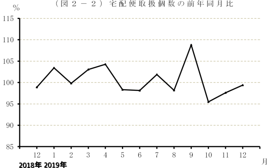
(図2-2) 宅配便取扱個数の前年同月比