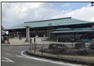
【代表施設】 宮島棧橋旅客ターミナル