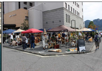
みやじまぐちそぞろまちあるき マルシェ