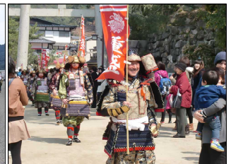
春を呼ぶ宮島清盛祭り