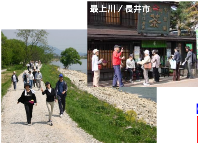
管理用通路をフットパスとして活用 (最上川)

治水上及び河川利用上の安全・安心に係る河川管理施設の整備を通じ、まちづくりと一体となった水辺整備を支援