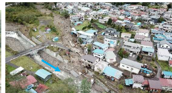
嬭恋村田代地区の被災状況(吾妻川)