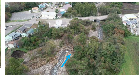
土砂・流木の堆積状況(湯尻川)