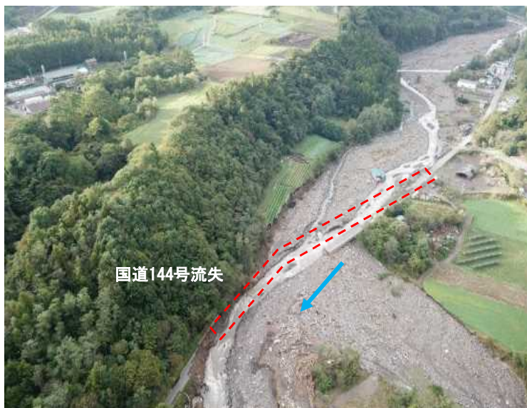
嬭恋村大笹地区の被災状況(吾妻川)