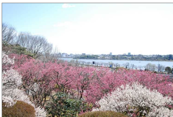
偕楽園公園(水戸市)