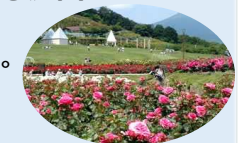
茨城県フラワーパーク