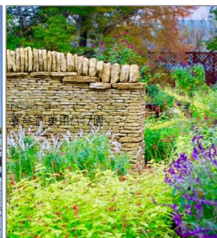
水戸市植物公園 (水戸市)