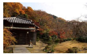
④旧山本条太郎別荘