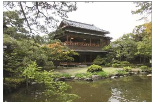
旧齋藤家別邸（新潟市）