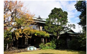
⑮松永記念館・老樗荘