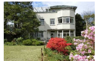
⑭小田原文学館別館