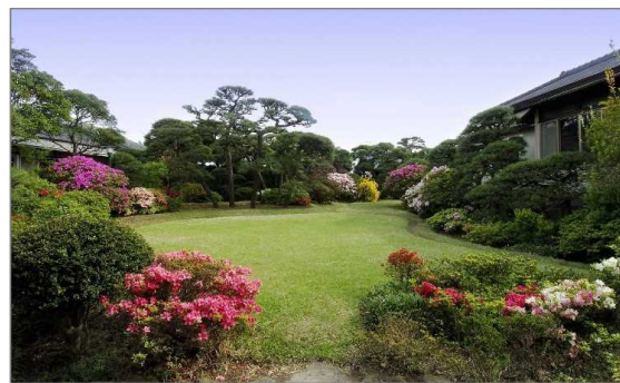
茅ヶ崎館(茅ヶ崎市)