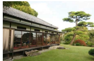
⑬小田原文学館本館