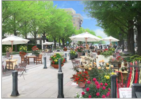
日本大通り（横浜市）