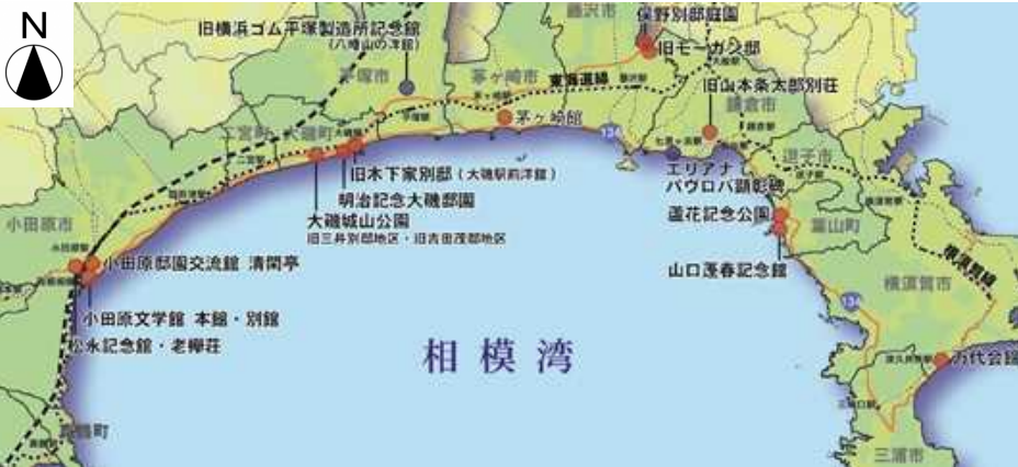
⑩明治記念大磯邸園 (整備中) ⑦茅ヶ崎館