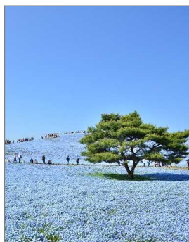
国営ひたち海浜公園 (ひたちなか市)