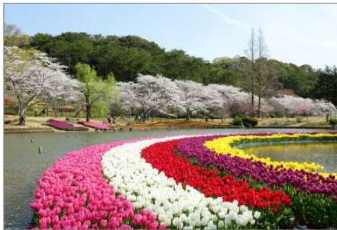
はままつフラワーパーク（浜松市）