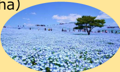
国営ひたち海浜公園