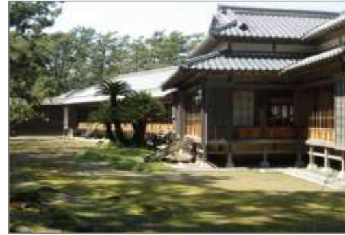
沼津御用邸記念公園（沼津市）