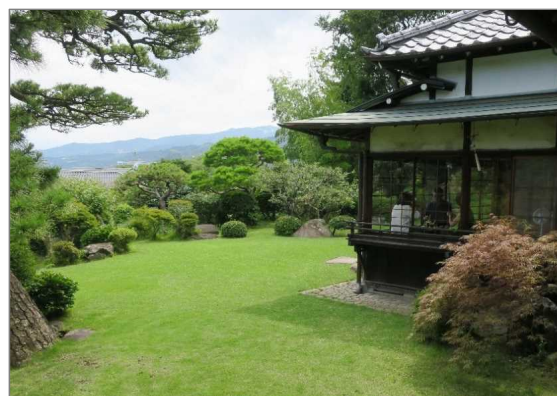
小田原邸園交流館 清閑亭(小田原市)