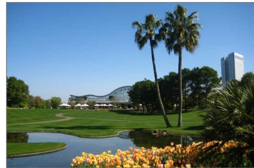
フローランテ宮崎（宮崎市）