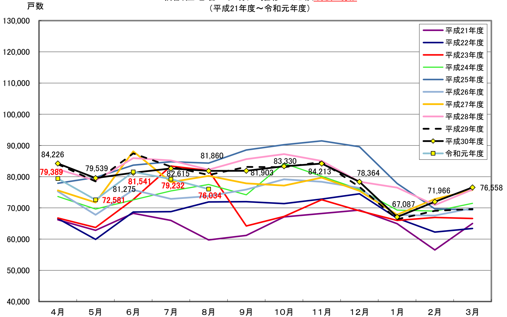
新設住宅着工戸数の推移の比較(総戸数) (平成21年度～令和元年度)