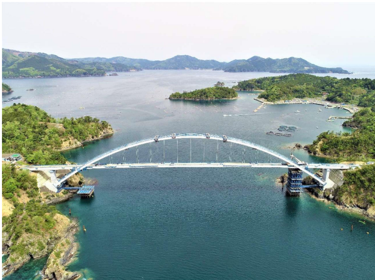
(現地状況(南側全景))