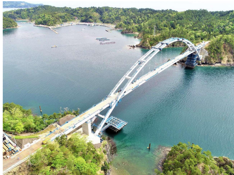
(現地状況(南西側から))