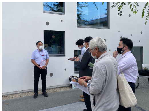
ぶら下がり会見の状況