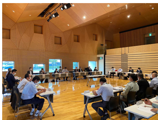
意見交換会の状況