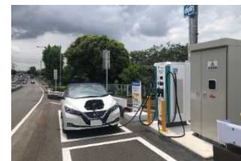
EV充電施設の道路内配置