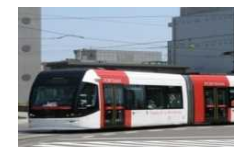
LRT (Light Rail Transit)