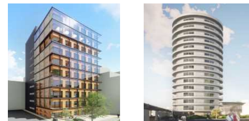
中高層の木造建築物