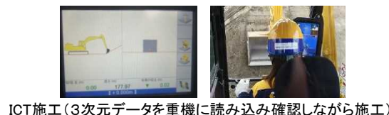
ICT施工(3次元データを重機に読み込み確認しながら施工)