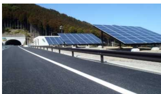
道路における太陽光発電施設活用