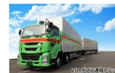
ダブル連結トラック