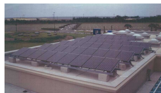
公園における太陽光発電