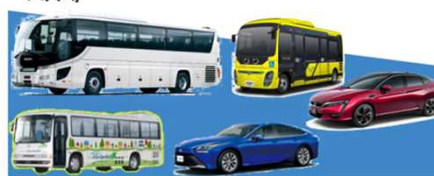
燃料電池タクシー、電気バス、プラグインハイブリッドバス等