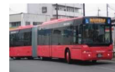
BRT (Bus Rapid Transit)