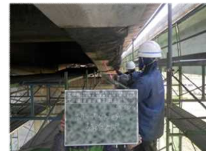
修繕の様子(断面修復)