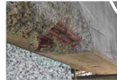
損傷状況(鉄筋露出)