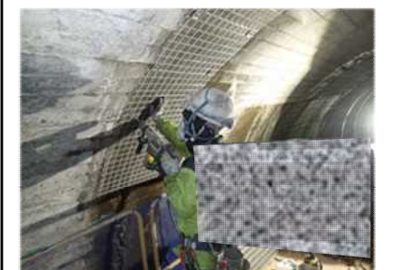
修繕の様子(剥落対策)