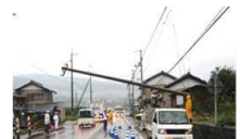
沿道の電柱の倒壊による道路閉塞