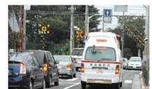
踏切道の長時間遮断による救急救命活動等への支障