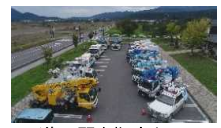
道の駅を拠点として活用した災害応急対策

② 緊急輸送道路等の沿道区域で、 電柱等の工作物を設置 する場合の 届出・勧告制度 を創設