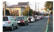
「開かずの踏切」による渋滞