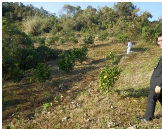
八朔等の栽培状況