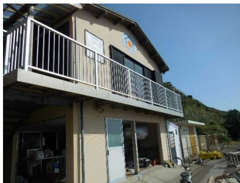
改修中の宿泊所(築島)