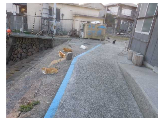
ネコのエサ場周辺