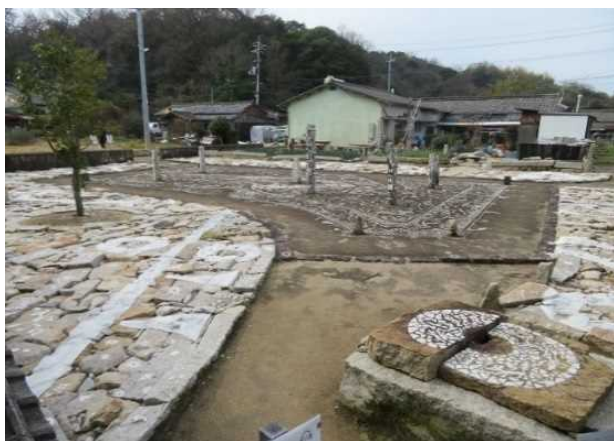
犬島「家プロジェクト」石職人の家跡