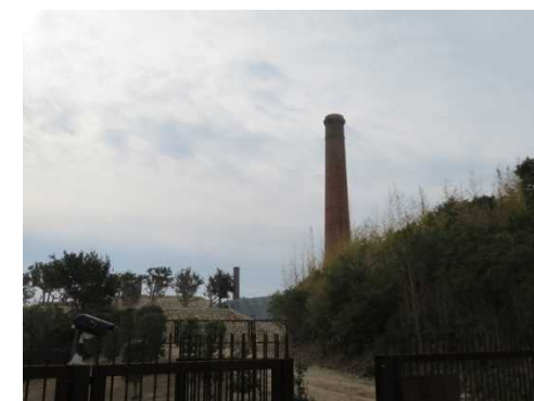
犬島精錬所美術館