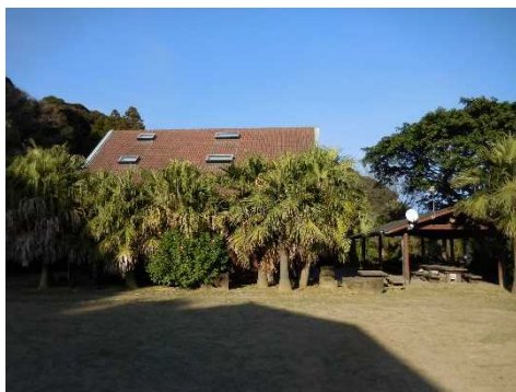
大島のキャビンとバーベキュー場