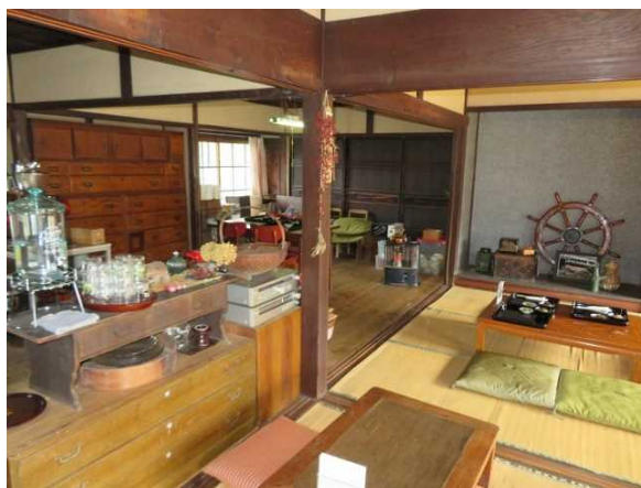
移住者が開く食事処