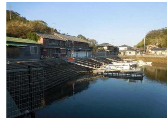
船着き場周辺の様子