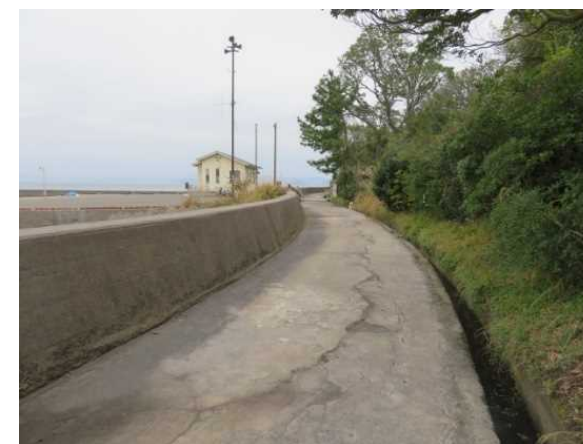
外周道路(奥は港・公民館)