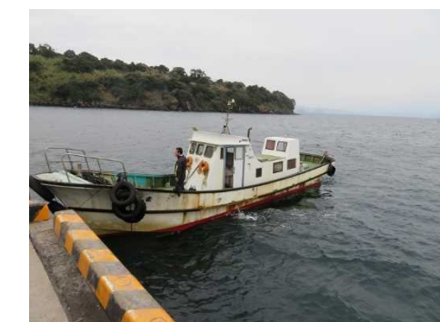
行政連絡船(12人乗り)