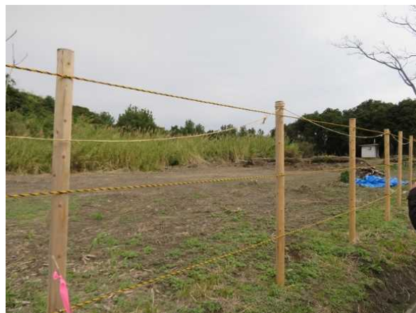
旧小学校を解体(キャンプ場整備予定)