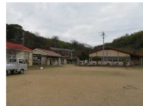
少年自然の家(旧小学校)