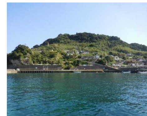
築島船着き場の全景