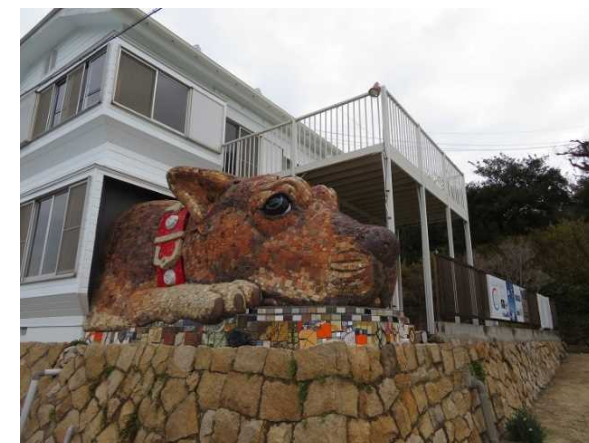
犬島の島犬(ハウスプロジェクト)