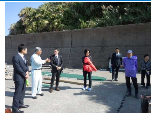
現地調査状況(築島)