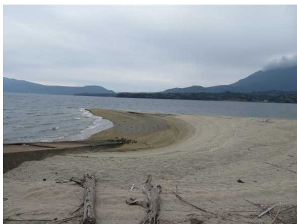
島南部の砂浜(奥には桜島)