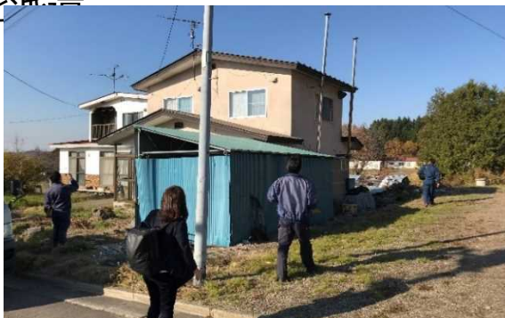
現地調査（特定空き家判定）