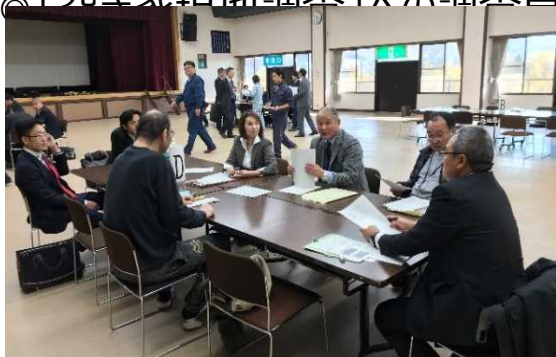
空き家セミナー、空き家個別相談会