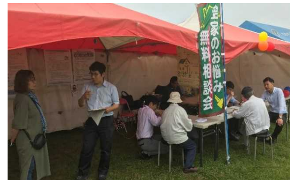
空き家相談ブース（同町町おこしイベント会場）