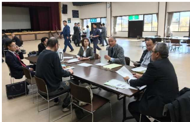
空き家セミナー、空き家個別相談会