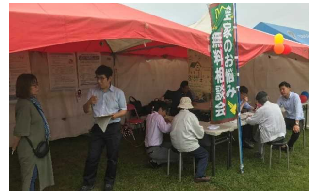
空き家相談ブース（同町町おこしイベント会場）