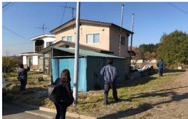
現地調査（特定空き家判定）