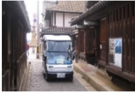
(福山市／H30実証調査 → H31.4.タクシー事業 運行開始)