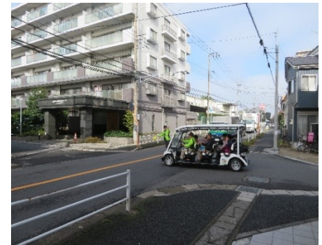
(松戸市／R元 実証調査)