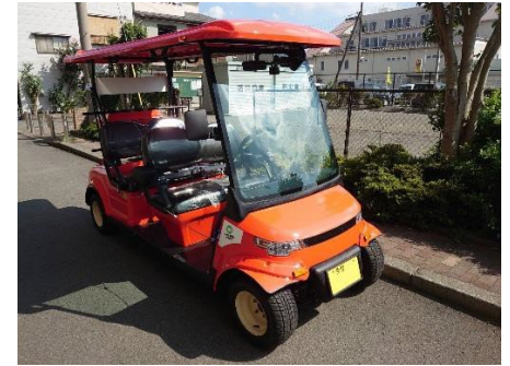
(町田市／R元.12. 自家用有償旅客運送 運行開始)