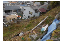
高台から瓦礫や岩石、柵等が落下するおそれ