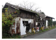
建築物のイメージ