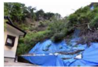
豪雨の度に土砂崩れが多発