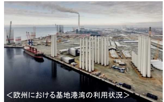
<欧州における基地港湾の利用状況>