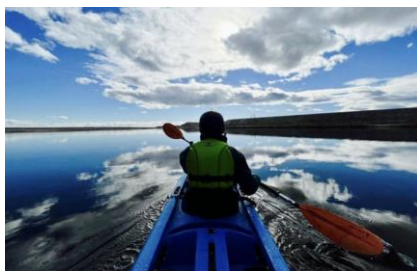
楢葉町木戸川河口の「カヤック体験」 を撮影し、インスタグラムで情報発信