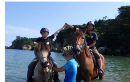
海辺の乗馬体験を組込んだ商品を造成