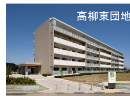
災害公営住宅整備 (宮城県名取市)