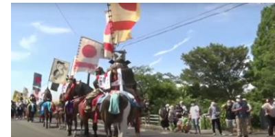
相馬野馬追インターネットライブ中継によるDX商品の創出

⇒ 今後、インバウンドの回復に向けた特別な体験や期間限定の取組の創出等への支援制度も活用し、 東北の観光復興を推進。