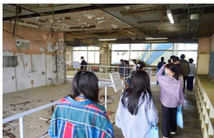
ホープツーリズムのプログラム造成のため モニターツアーを実施 (震災遺構 浪江町立請戸小学校)