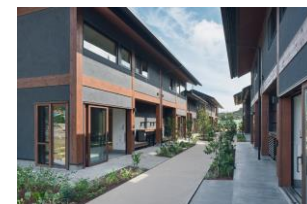
帰還者向け災害公営住宅等建設地 (双葉町 双葉駅西側地区)