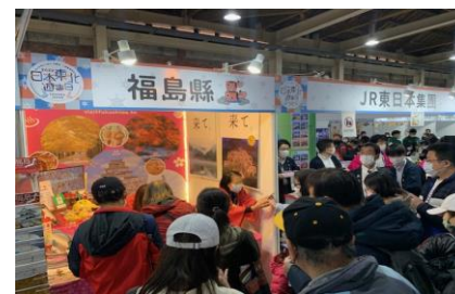
台湾で開催の旅行博に出展し、 福島の魅力をPR