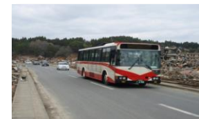
被災地域間幹線系統確保維持事業