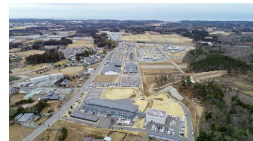
福島復興再生拠点整備事業 (大熊町 大川原地区 R3.3完了 R5.1撮影)