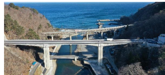
三陸沿岸道路 普代～久慈 (25.0km)開通 (R3.12.18)