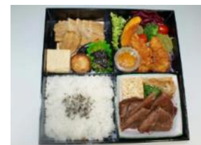
三陸・常磐ものを使った弁当販売