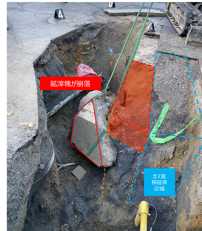
側面の鉋滓塊が崩落し、作業員が下敷きとなった。