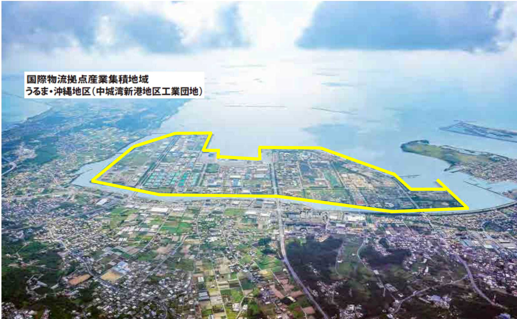
国際物流拠点産業集積地域 うるま・沖縄地区(中城湾新港地区工業団地)