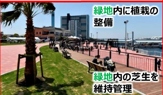
「植栽」の整備・「緑地」の整備等