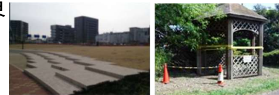
【老朽化・陳腐化した港湾緑地の例】