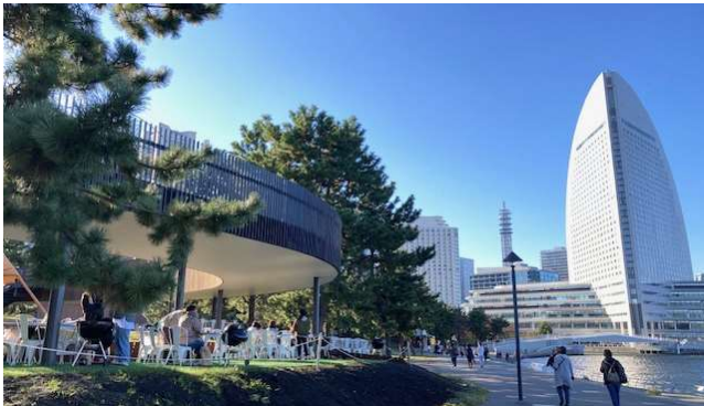
賑わい交流拠点の整備