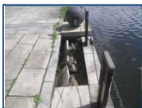
※鋼矢板開口部からの裏埋土砂流出が原因