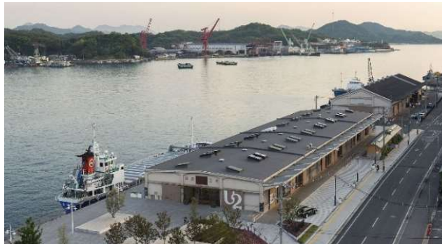
港湾施設(上屋)のリノベーション