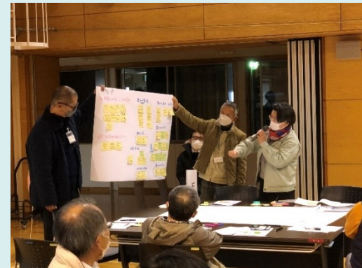
意見交換会の様子