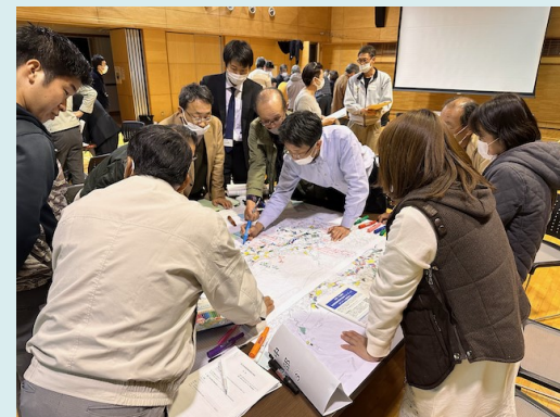
意見交換会の様子