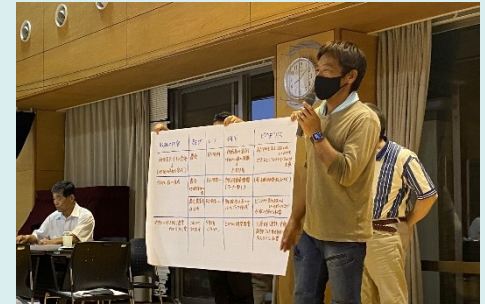
意見交換会の様子