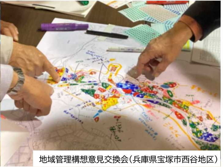
地域管理構想意見交換会(兵庫県宝塚市西谷地区)