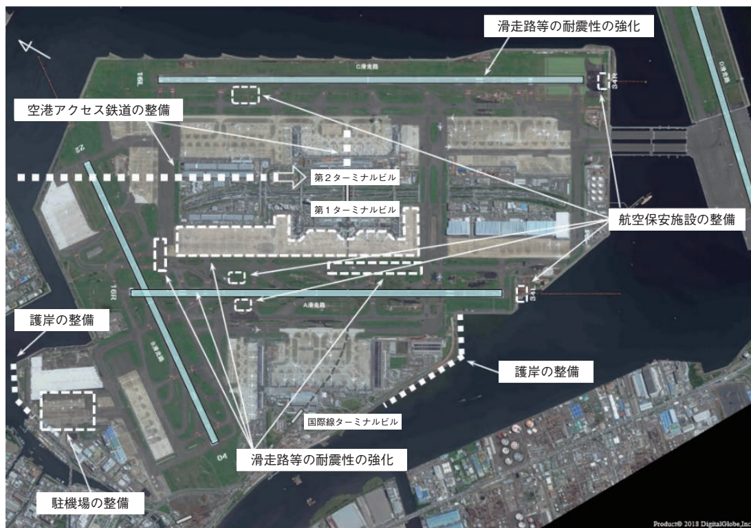
図表2-4-1 東京国際（羽田）空港の整備