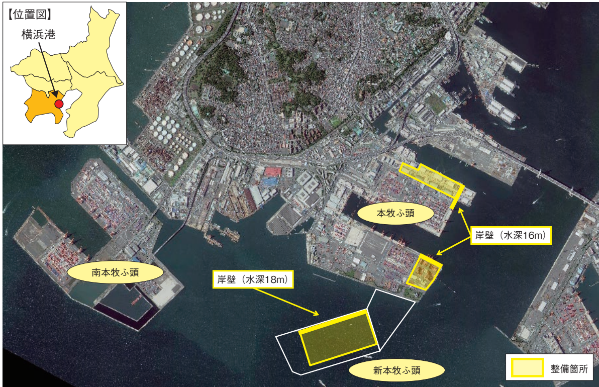
図表2-4-4 横浜港国際海上コンテナターミナル再編整備事業（大水深コンテナターミナル）

また、京浜港の物流ネットワークを形成するため、東京港臨港道路南北線、川崎港臨港道路東扇島水江町線、横浜港南本牧～本牧ふ頭地区臨港道路の整備を進めている。