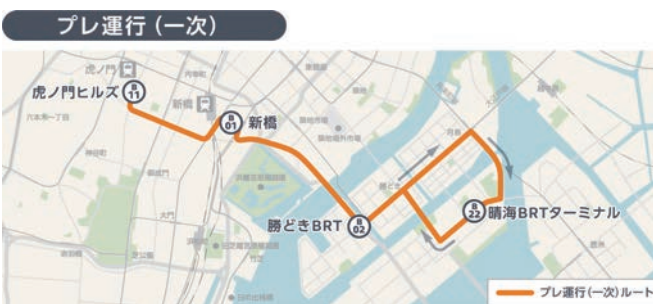
図表2-4-8 BRT運行ルート(大会期間前・期間中 プレ運行(一次))、デザイン