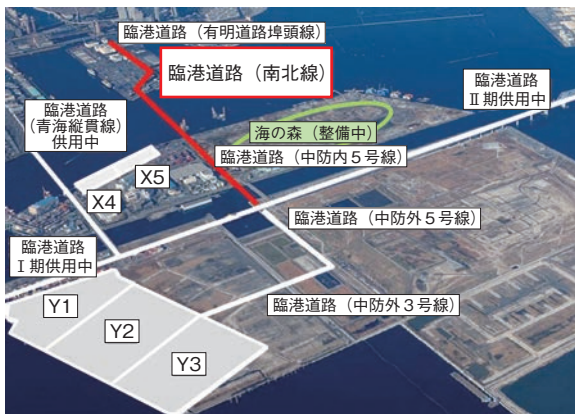
図表2-4-6 東京港臨港道路南北線の概要

さらに、東京2020大会開催前や開催中に首都直下地震が発生することも想定し、本大会の開催を支えるため、平成29(2017)年8月、国土交通省及び関係機関の防災情報提供ツールを一元化し、多言語化やスマートフォン対応により、海外や国内において平時から容易に防災情報等を入手できる「防災ポータル/Disaster Prevention Portal」を開設している。また、平成30(2018)年の平成30年7月豪雨、同年2月の大雪、同年3月の霧島山(新燃岳)噴火等、近年頻発する災害を踏まえ、地震以外の災害の情報やライフライン情報、多言語対応サイトを追加する等、そのコンテンツを充実している(図表2-4-10)。