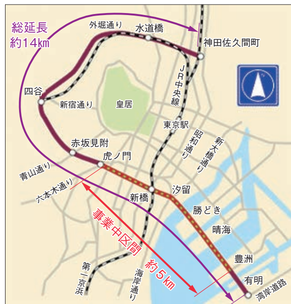
図表2-4-7 東京都市計画道路環状第二号線の概要