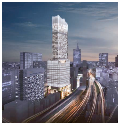
図表2-4-11 (仮称) 歌舞伎町一丁目地区開発計画（新宿TOKYU MILANO再開発計画）外観イメージ

このほか、首都圏内における直近（令和(2019)年度末現在）の事例としては、特定都市再生緊急整備地域「東京都心・臨海地区」において、令和元(2019)年7月、「虎ノ門・麻布台地区第一種市街地再開発事業」（東京都港区）が、民間都市再生事業計画の認定を受けている。