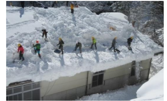
●住家の屋根形状や雪の質量等のデータから適切な雪下ろしのタイミングを判断