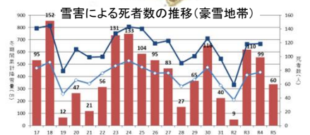
〔住家の屋根形状や除雪作業中の死傷事故データ〕