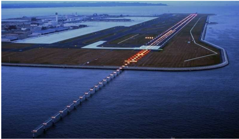
中部国際空港の飛行場灯火（CAT-III精密進入灯火）