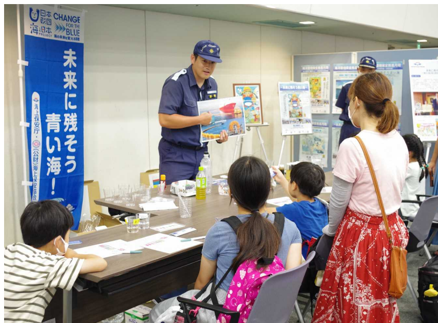
きれいな海を守るためにできることは ～ 海洋環境教室 ～