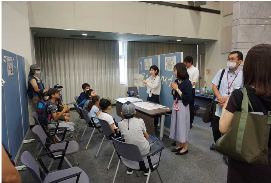
国土クイズ 何問わかったかな？