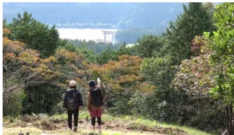
（2日目）ワーケーションスポット・バーチャルツアー