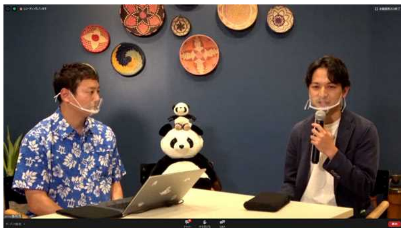
（1日目）ワーケーション導入ガイダンスウェビナー