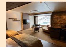
バリアフリー客室の整備