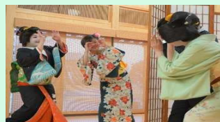
地域の観光資源を活かした商品造成