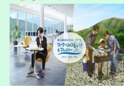
ワーケーションの普及