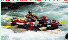
アドベンチャーツーリズム