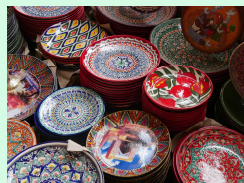
輸入品販売事業への事業展開