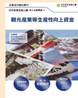
観光産業等生産性向上資金