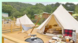
グランピング・キャンプ用品等のレンタル事業への展開