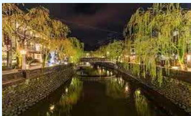
観光地の面的な再生（イメージ）