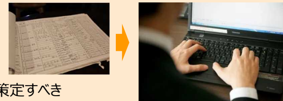
紙台帳等のアナログな管理に代わる顧客管理システムの導入