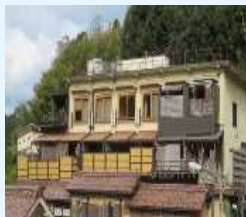
廃屋撤去・跡地利用（イメージ）