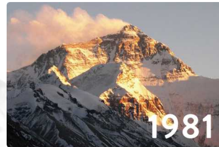
チベット側 B.C. から仰ぎ見る、世界最高峰チョモランマ (エベレスト) (8,848m) 北壁