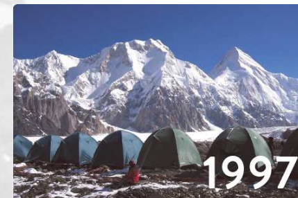
カザフスタン、南イニリチェク氷河からの天山山脈の名峰ハンテングリ (7,010m) (右奥)