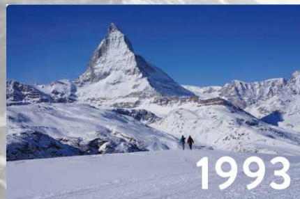
冬のマッターホルン (4,478m) 山麓で、歩きやすく圧雪し、整備されたスノートレイルをハイキング