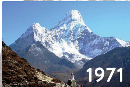
クーンブ山群の秀峰アマダブラム (6,812m) を正面に、エベレスト街道をトレッキング