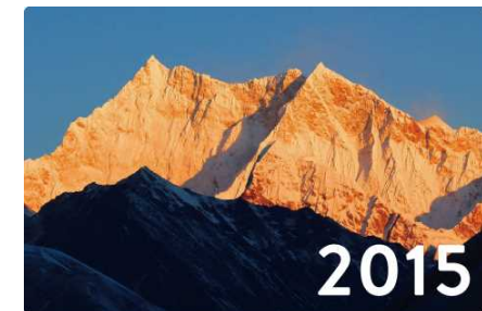
朝陽に輝く、ブータン最高峰で未踏の世界最高峰ガンカーブンスム (7,564m) の南東壁