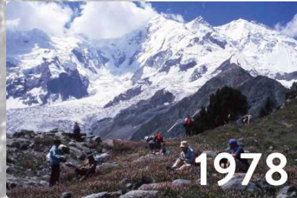
ファンザ川から高距 5,700m で聳立する、カラコルムの名峰ラカポシ (7,788m)。B.C. 上部にはお花畑も