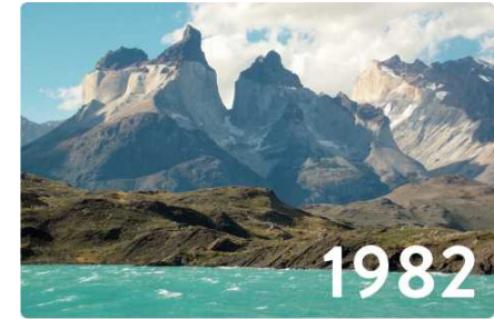
パタゴニア・パイネ山群の盟主で、パイネの角とも呼ばれる、クエルノ・デル・パイネ (2,600m)