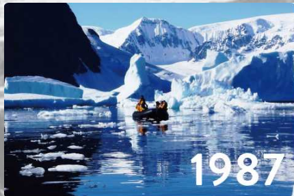
クルーズ母船からゾディアックポートに乗り換え、氷塊を避けながら氷の大地、南極大陸上陸をめざす