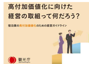
宿泊業の高付加価値化のための経営ガイドライン