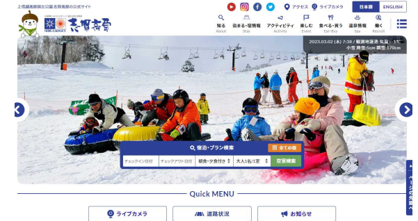
シームレスな情報発信・予約・決済が可能な地域サイト事例