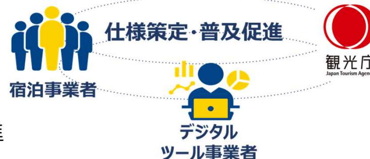
データ仕様の統一化・API化に向けた体制