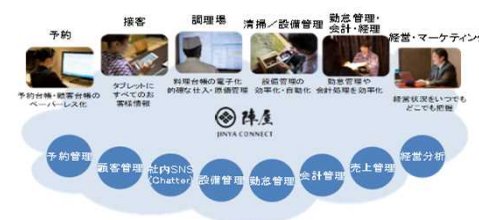
PMS等のデジタルツール導入による業務の効率化