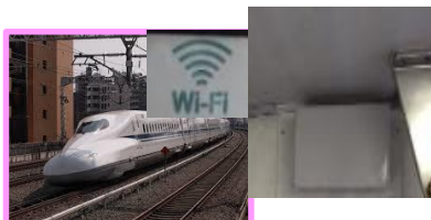
車両における公衆無線LAN