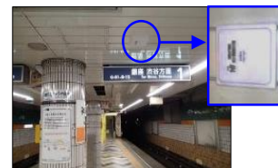
旅客施設における公衆無線LAN