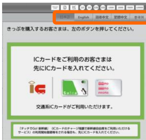
第2回検討会の JR東日本資料より