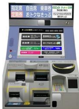
第2回検討会の JR東日本資料より