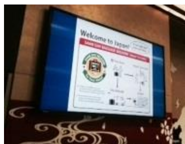
手ぶら観光情報を発信するデジタルサイネージ