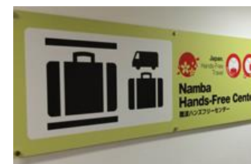
多言語で場所を案内する看板