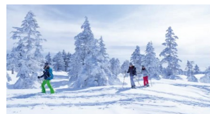
パウダースノーを活かしたガイドツアーの造成等により、消費額や滞在満足度の向上