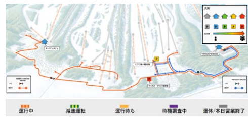
リフト運行情報、ゲレンデの混雑、二次交通の位置などのリアルタイム情報を提供するアプリやデジタルサイネージの導入などDX推進による利便性向上