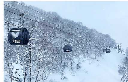
索道の更新に併せ、設置位置や滑走コースの構成を見直し、利便性・快適性を向上