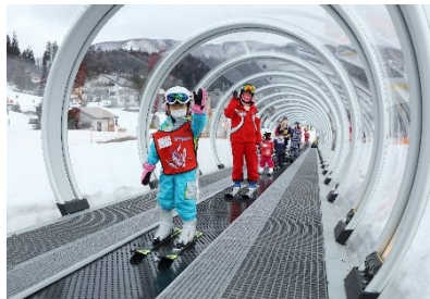
スノーエスカレーターの導入により、初心者・キッズ向けコースの利便性を向上