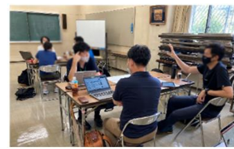
地域における協議