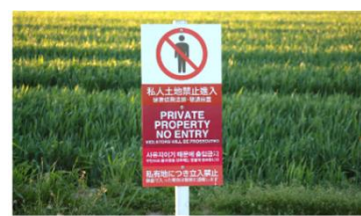
看板・デジタルサイネージの設置