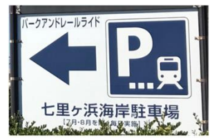
パークアンドライドの実施