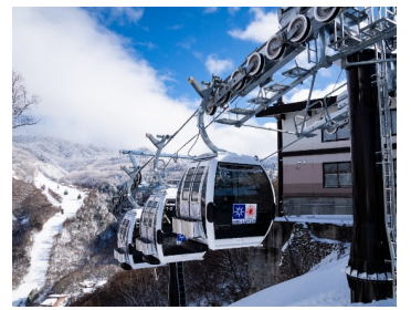
索道の再編や搬器の大型化・高速化により、混雑を改善し、快適性・満足度を向上