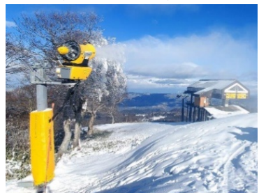
高機能な降雪機の導入により、営業期間を最大化・明確化