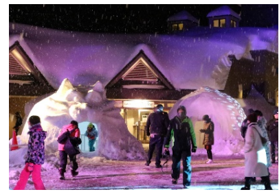
アフタースキーを楽しめる環境を整備し、外国人観光客の長期滞在を促進