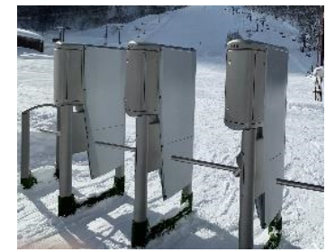
ICゲートシステムの導入により、リフト券の共通化や顧客データ取得を促進