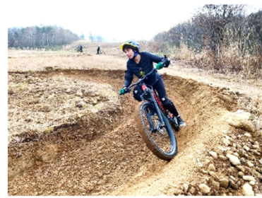
グリーンシーズンも楽しめる環境を整備し、通年での誘客を促進