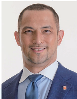
スポーツ庁長官 室伏 広治