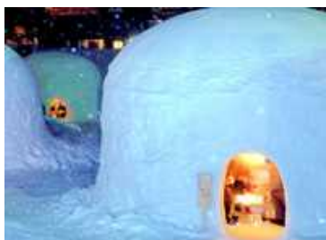
アフタースキーを楽しめる環境を整備し、外国人観光客の長期滞在を促進