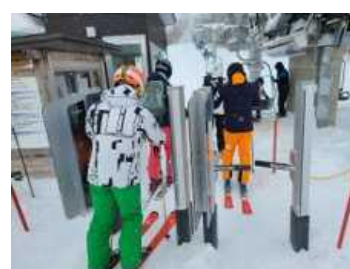
ICゲートシステムの導入により、複数スキー場への周遊を促進