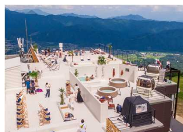
グリーンシーズンも楽しめる環境を整備し、通年での誘客を促進