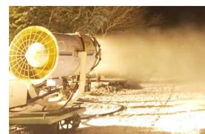
高機能な降雪機の導入により、営業期間を最大化・明確化