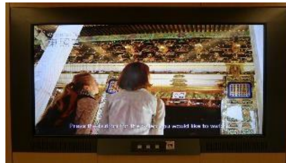
タッチパネル式解説板による案内 (多言語字幕)