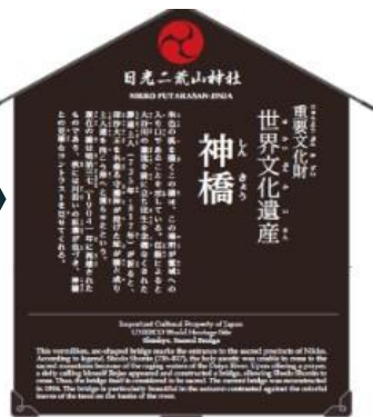
日光二荒山神社神橋 看板の改善