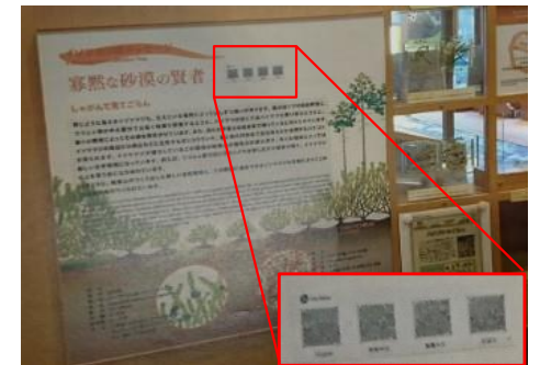
2次元コード (多言語音声・テキスト)