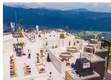
グリーンシーズンも楽しめる環境を整備し、通年での誘客を促進