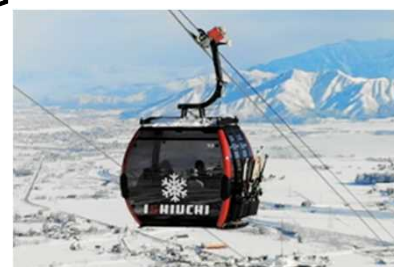
索道の再編や搬器の大型化・高速化により、混雑を改善し、快適性・満足度を向上