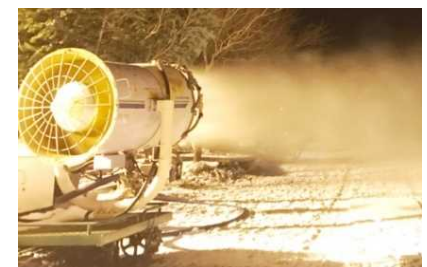
高機能な降雪機の導入により、営業期間を最大化・明確化