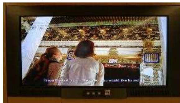
タッチパネル式解説板による案内 (多言語字幕)