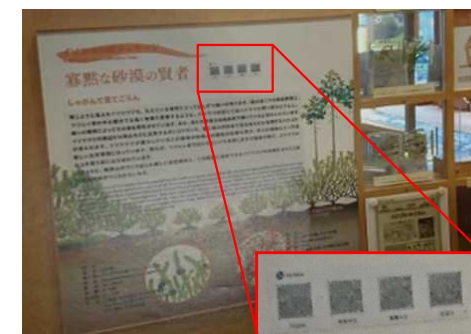
二次元コード (多言語音声・テキスト)