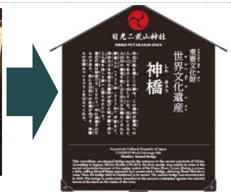
日光二荒山神社神橋 看板の改善