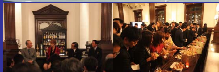
大丸有まちづくり協議会 設立25周年イベント