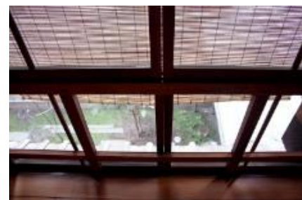
地場製作の木製建具